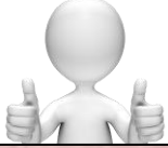
تحريك بواعث الخير في النفس